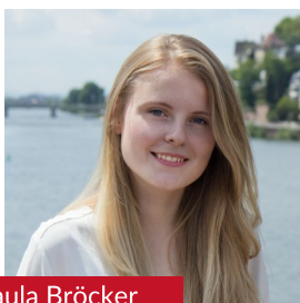
Paula Bröcker Platz 3